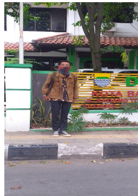
Gambar 2 Dinas Lingkungan Hidup dan Kebersihan